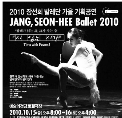
Plakat ze spektaklu baletowego Czas na poezję

wierszy Szymborskiej, m.in. Możliwości . Tym samym poezja Szymborskiej została wyrażona mową ciała ludzkiego.