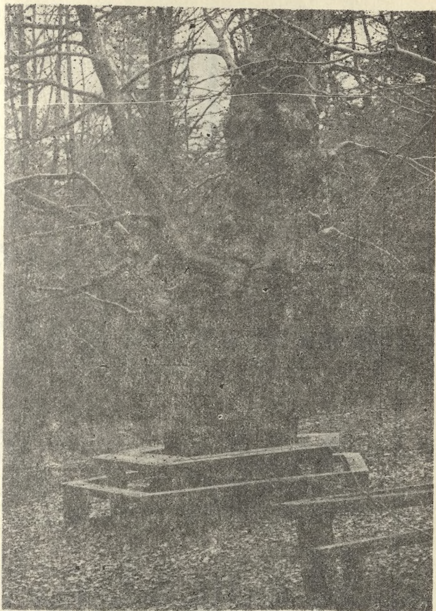
Ryc. 2. „Buk Jagielly” — najgrubszy w Świętokrzyskim Parku Narodowym; (Fot. R. Kapuściński)