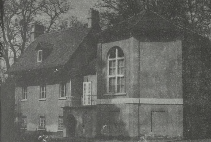
Muzeum dendrologiczne w Arboretum

kania, dzięki czemu szybko wzrastała liczba pracowników naukowych (w 1955 r. już 20 osób). W tym czasie Zakład Dendrologii i Pomologii obejmuje placówkę naukową w Kórniku wraz z Arboretum, Stację Badawczą Zadrzewień Śródpolnych w Turwi oraz gospodarstwo pomocnicze w Kórniku wraz ze szkółkami. W Zakładzie czynnych było 5 pracowni, a także szereg działów pomocniczych, takich jak Arboretum, Biblioteka, Zielnik, Muzeum Dendrologiczne, Stacja Meteorologiczna. W 1958 r. Zakład przejmuje Las Doświadczalny Zwierzyniec o powierzchni 180 ha, gdzie wkrótce zostały założone liczne doświadczenia oraz kolekcje dendrologiczne drzew iglastych i różaneczników.