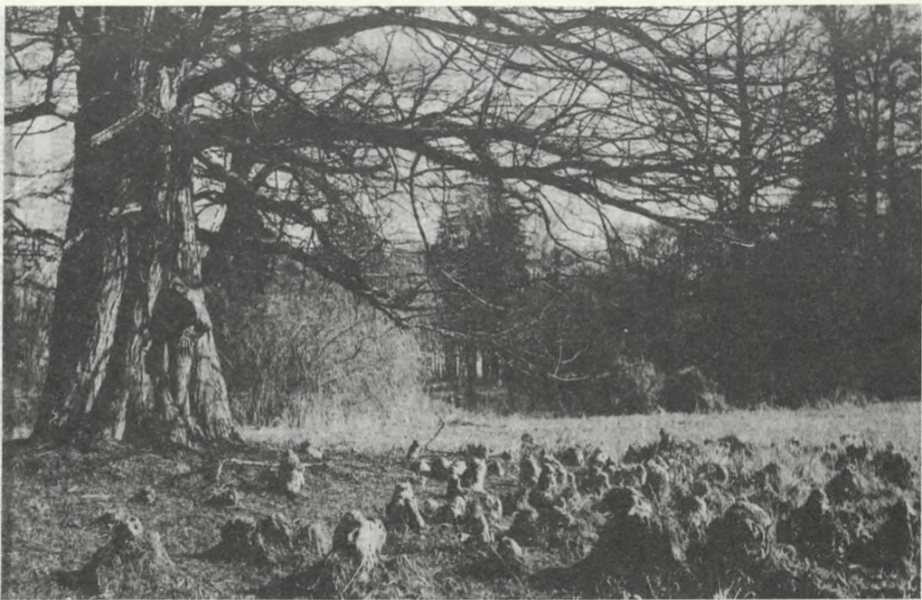
Cypryśnik błotny ( Taxodium distichum Rich).