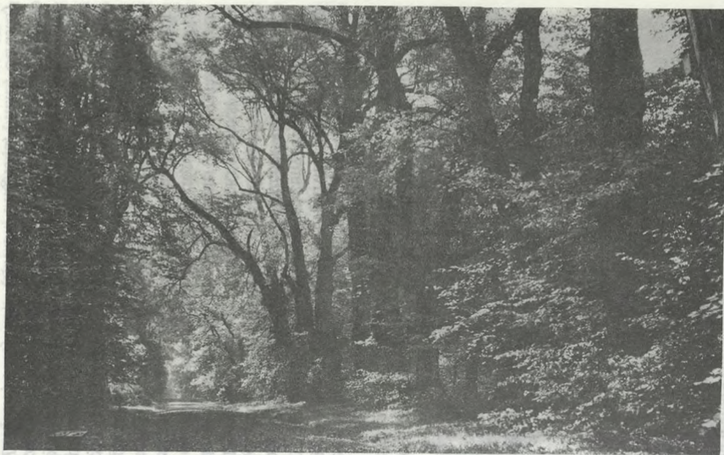
Stara aleja lipowa w Arboretum.