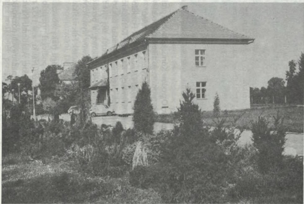
Nowy budynek Instytutu (1986)