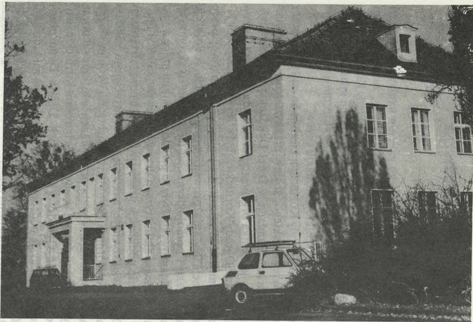
Pierwszy budynek Instytutu (1955)