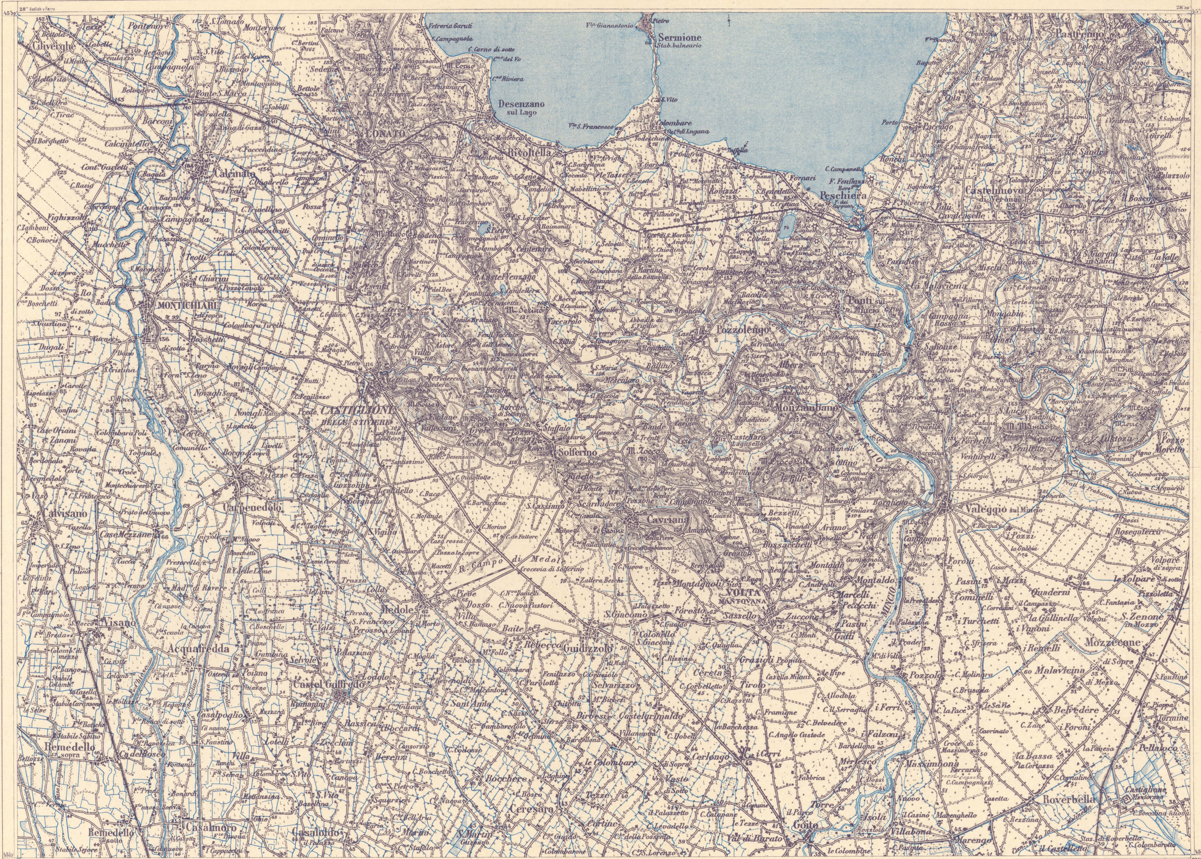
Auf Grund der Carta topografica del Regno d'Italia v. 1892, 1898 u. 1894.