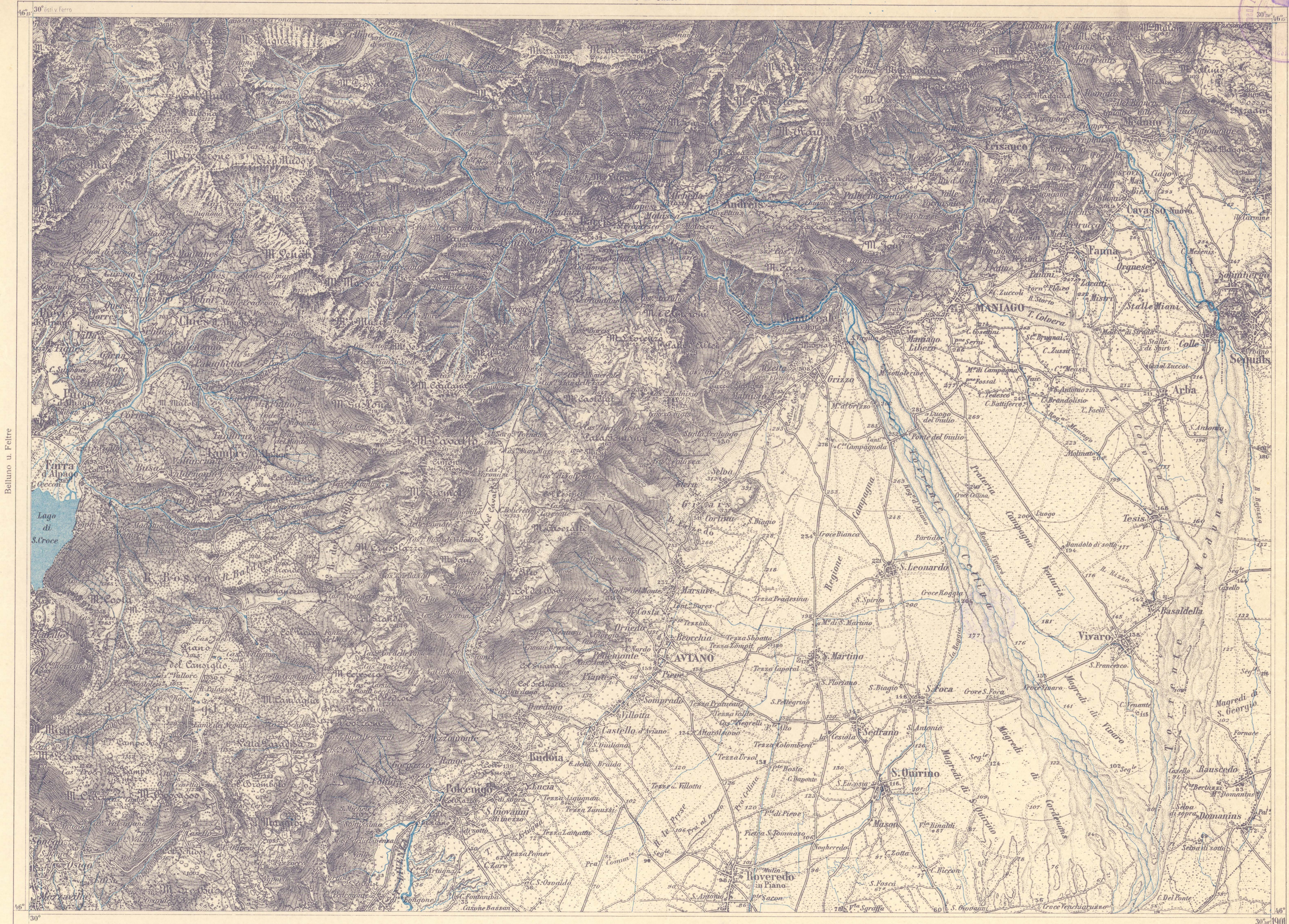
Auf Grund der Carta topografica del Regno d'Italia von 1899 u. 1900.