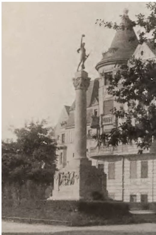
6. Kriegerdenkmal (pomnik Wojowników) na Kriegerdenkmalplatz, ok. 1926; Glogau , Hrsg. E. Stein, Series: „Monographien deutscher Städte”, Berlin-Friedenau 1926.

Przebieg likwidacji umocnień twierdzy, znacznie szybszy niż w pozostałych omawianych przypadkach, oraz kompleksowe planowanie rozwoju miasta umożliwiły umieszczenie w obrębie plant na dobrze skomunikowanych, prestiżowych i eksponowanych parcelach ważnych budynków publicznych. Sąsiedztwo terenów zielonych nie tylko wpływało na malownicze otoczenie, ale także miało zwiększyć ruch na promenadzie w dni powszednie, a w dni wolne, podczas spaceru, mieszczanie podziwiali siedziby instytucji (głównie państwowych). Największe wrażenie mógł robić neoklasycyzyzm gmach sądu okręgowego z lat 1910–1911 46 . Budynek ten miał charakter klasycystycznej architektury pałacowej, o uproszczonej, masywnej bryle oraz ryzalicie zwieńczonym naczółkiem i z podjazdem w dolnej kondygnacji. Umieszczony został na terenie Starego Miasta, tuż nad skarpą fosi miejskiej. Można go było podziwiać w całej okazałości z promenady południowej. Warto wspomnieć też