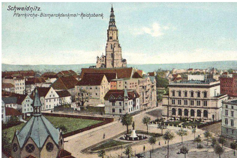
4. Świdnica, Sedan Platz z pomnikiem Bismarcka i gmachem Banku Rzeszy, po lewej u dołu widoczna kopuła synagogi; https://dolny-slask.org.pl/968434,foto.html?idEntity=516176 (dostęp: 2 V 2018).

a stojącą przy nim świątynię na kościół garnizonowy. Położenie przy pasie fortecznym było dość niefortunne, zarówno jeśli chodzi o ekspozycję działki, jak i o jej ewentualne zniszczenie w trakcie oblężenia. Po defortyfikacji sytuacja znacznie się zmieniła. Uzyskano kilka obszernych parceli, które znalazły się przy nowo wytyczonym ringu i były własnością państwa. Dawne, często średniowieczne budynki klasztorne stopniowo wyburzano i tak w miejscu klasztoru Dominikanów przy Wilhelmsplatz wybudowano w latach 80. gmach sądu krajowego i więzienia 31 , a przy Köppenstr. (ul. Franciszkańska) na działce po klasztorze Franciszkanów powstało gimnazjum ewangelickie.