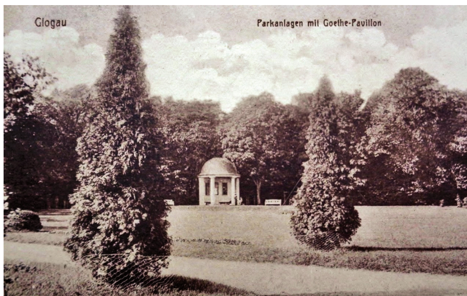
7. Pawilon Goethego w południowej części promenady; https://dolny-slask.org.pl/6923524,foto.html?idEntity=548080 (dostęp: 2 V 2018).

nia ich po splantowaniu, ma pochodzenie francuskie i pojawiła się na Śląsku w trakcie wojen napoleońskich. Wcześniej nie prowadzono raczej planowych defortyfikacji na tym terenie. Wyjątkiem jest tu Legnica, której umocnienia zaczęto wyburzać już w 1758 r., a powstałe na ich miejscu prywatne ogrody i fragmenty zieleni publicznej szybko przeznaczono pod zabudowę 51 . Punkt ciężkości zainteresowania mieszczaństwa przeniósł się tam na obszar Parku Miejskiego znajdującego się prawie w całości poza miastem.