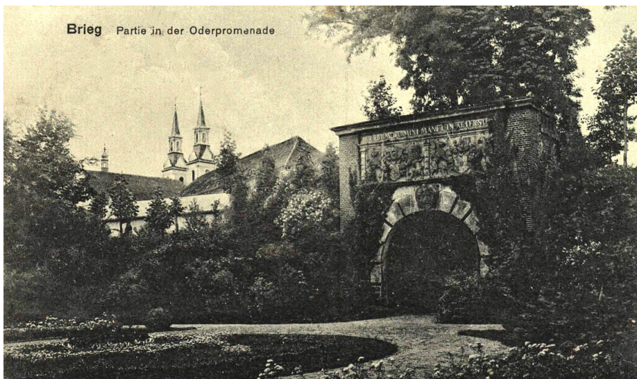
2. Brama Odrzańska, ok. 1919; Wojewódzka Biblioteka Publiczna w Opolu.