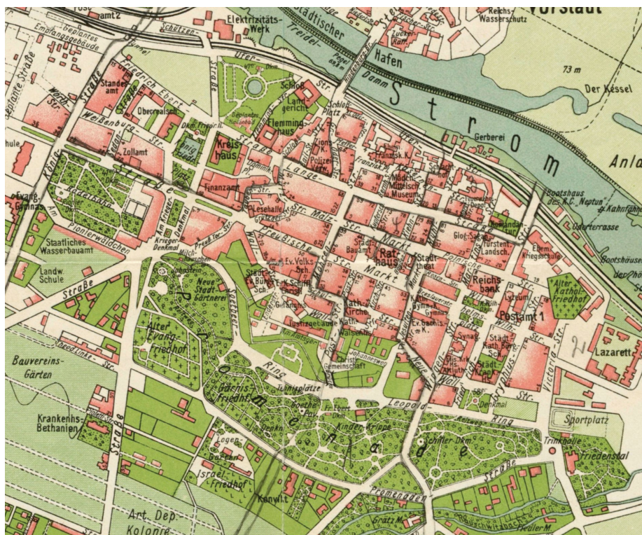
5. Plan Głogowa, ok. 1930, wydany przez Geographisches Institut Carl Flemming u. C.T. Wiskott A.-G., fragment; Oddział Zbiorów Kartograficznych Biblioteki Uniwersytetu Wrocławskiego.

promenady, dochodzącym aż do rzeki i graniczącym od wschodu z dawnym zamkiem piastowskim, był duży zieleniec z okrągłym tzw. stawem Flemminga 43 pośrodku.