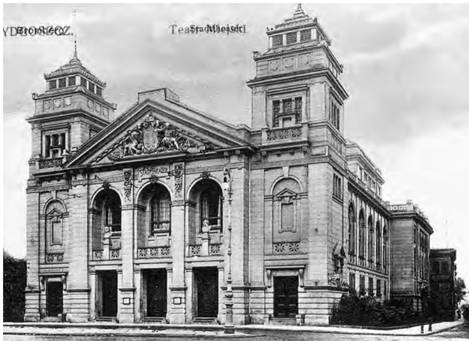
8. Teatr Miejski w Bydgoszczy przy pl. Teatralnym, obecnie nieistniejący, pocztówka z początku XX w.; ze zbiorów prywatnych.