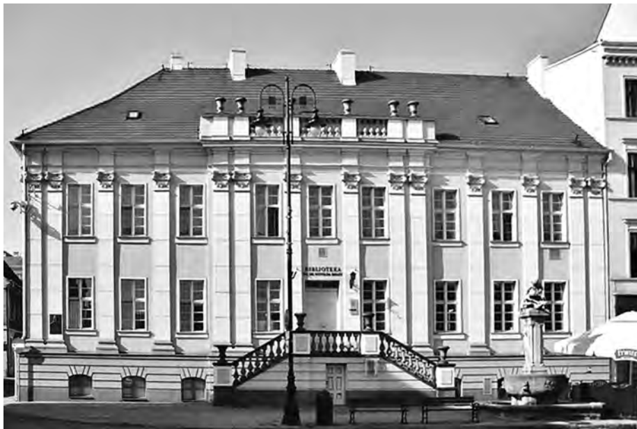
1. Gmach Deputacji Kamery Wojenno-Domenalnej, obecnie Wojewódzka i Miejska Biblioteka w Bydgoszczy, przy Starym Rynku 24.