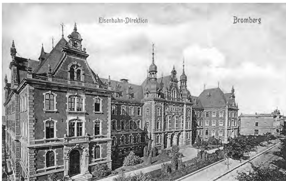
7. Gmach Królewskiej Dyrekcji Pruskiej Kolei Wschodniej, obecnie Collegium Medicum UMK przy ul. Dworcowej 67 w Bydgoszczy, pocztówka z początku XX w.; ze zbiorów prywatnych.