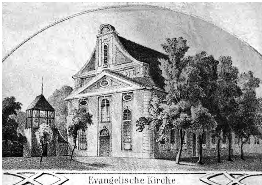
2. Stara fara ewangelicka w Bydgoszczy przy ul. Podwale, ryc. Juliusa Gretha, wyburzona ok. 1903 r., Julius Greth: http://www.muzeum.bydgoszcz.pl/ .