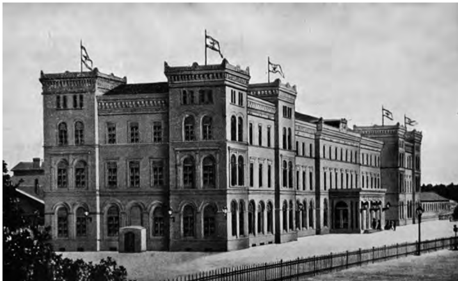
5. Budynek dworca kolejowego w Bydgoszczy po rozbudowie w 1861 r., pocztówka z końca XIX w.