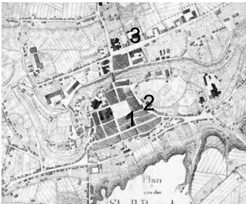
4. Fragment planu Bydgoszczy z 1835 r. z zaznaczonymi budynkami: 1 – gmachy Deputacji Kamery Wojenno-Domenalnej i Sądu Nadwornego, 2 – stara fara ewangelicka, 3 – gmach Regencji Bydgoskiej; opracowanie własne.