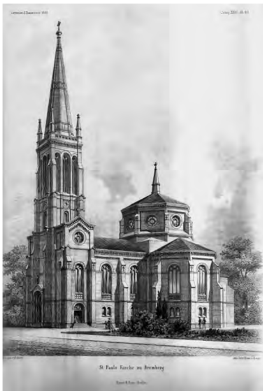
6. Kościół św. Pawła, obecnie kościół św. św. Piotra i Pawła na pl. Wolności w Bydgoszczy; reprodukcja w: „Zeitschrift für Bauwesen” 1882.