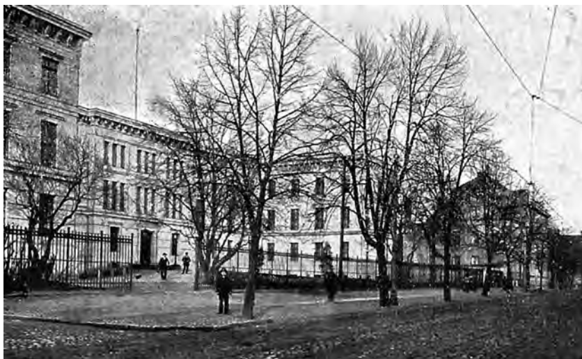
3. Nowy gmach Regencji Bydgoskiej, obecnie siedziba Kujawsko-Pomorskiego Urzędu Wojewódzkiego przy ul. Jagiellońskiej 3, pocztówka z początku XX w.; ze zbiorów prywatnych.