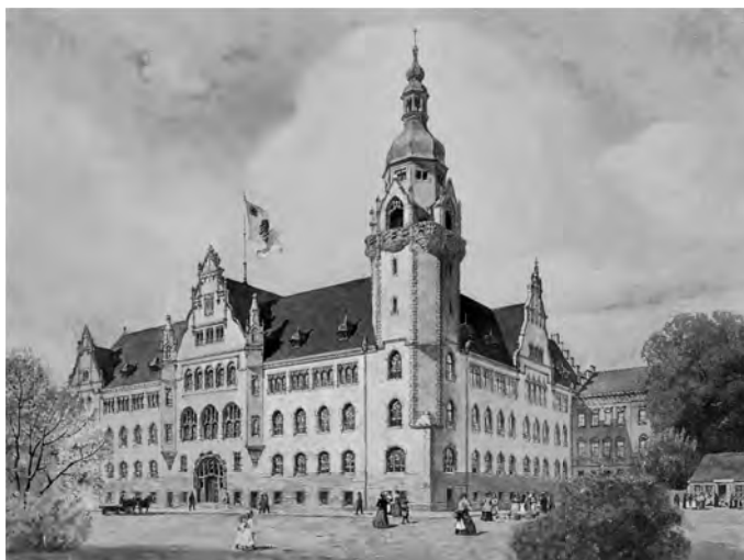
9. Gmach Pruskiego Królewskiego Sądu Rejonowego i Okręgowego, obecnie Sąd Okręgowy w Bydgoszczy, przy ul. Wały Jagiellońskie 2, akwarela E. Saala; reprodukcja ze zbiorów Berlin Architekturmuseum der TU, Inv.-Nr. 19365.