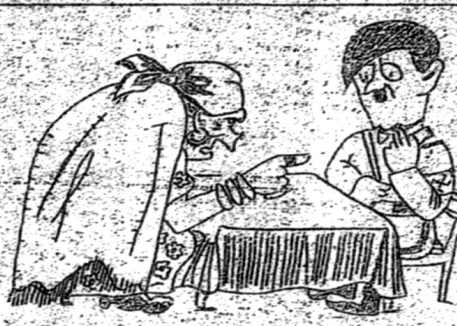
HITLER II WROZKI Rysunek ze "Głębokiej Anegdota"

Poca blyskion fa - torworków rauowony - z jednej owili, nic - rak wykonoyowa - tych "sziszów", z ty - tu anegdot kawiar - zianych. Na wszyst - kich uderza to samo - słowoy występują w nich nie jako groź - ni. Wawicy, leaz jako