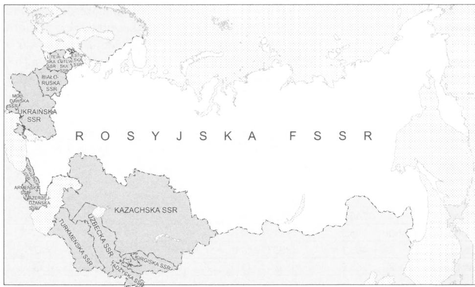
Ryc. 3. Podział administracyjny Związku Sowieckiego w 1989 r.

System administracyjny Federacji Rosyjskiej był stabilny. Weryfikacje odniesione do liczby, usytuowania i granic jednostek obwodowych czy rejonowych były podejmowane sporadycznie. Pewnej istotnej modyfikacji dokonano dopiero w 2000 r. Na podstawie dekretu prezydenta Władimira Putina zostały utworzone okręgi federalne. Mają one na celu osłabienie pozycji gubernatorów. Powstało siedem wielkich okręgów federalnych, grupujących po kilkanaście autonomicznych jednostek federacji. Nie pokrywają się one z regionami ekonomicznymi. Z punktu widzenia ustawodawstwa rosyjskiego nie są jednostkami podziału administracyjnego kraju. Celem przeprowadzonej reformy było, jak podkreślały władze centralne, zahamowanie postępującej dezintegracji kraju. Wydzielono siedem okręgów federalnych o ściśle określonych granicach i niezbyt klarownie określonych kompetencjach: