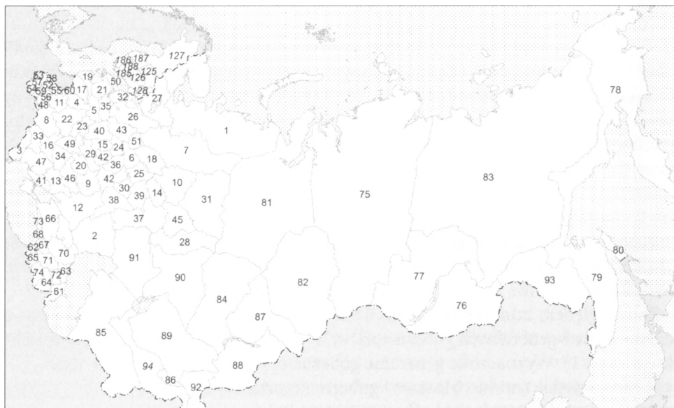
Ryc. 1. Podział administracyjny Cesarstwa Rosyjskiego w 1914 r.

GUBERNIE: 1. Archangielska 2. Astrachańska 3. Bessarabska 4. Wileńska 5. Witebska 6. Włodzimierska 7. Wołogodzka 8. Wołyńska 9. Woroneska 10. Wiacka 11. Grodzieńska 12. Dońska 13. Jekaterynosławska 14. Kazańska 15. Kałuska 16. Kijowska 17. Kowieńska 18. Kostromska 19. Kurlandzka 20. Kurska 21. Inflancka 22. Mińska 23. Mohylewska 24. Moskiewska 25. Niżnogrodzka 26. Nowogrodzka 27. Ołoniecka 28. Orenburska 29. Orłowska 30. Penzeńska 31. Permska 32. Piotrogadzka 33. Podolska 34. Połtawska 35. Pskowska 36. Riazańska 37. Samarska 38. Saratowska 39. Symbirska 40. Smoleńska 41. Taurydzka 42. Tambowska 43. Twerska 44. Tułska 45. Ufijska 46. Charkowska 47. Chersońska 48. Chełmska 49. Czernihowska 50. Estlandzka 51. Jarosławska 52. Warszawska 53. Kaliska 54. Kielecka 55. Łomżyńska 56. Lubelska 57. Piotrkowska 58. Płocka 59. Radomska 60. Suwalska 61. Bakijska 62. Białomska 63. Dagestańska 64. Elżawietpolska 65. Karska 66. Kubańska 67. Kutajska 68. Suchumski okr. 69. Sławropolska 70. Tarska 71. Tyfińska 72. Zakatalański okr. 73. Czarnomorska 74. Eriwańska 75. Jemaiska 76. Zabajkalska 77. Irucka 78. Kamczacka 79. Nadmorska 80. Sachalin 81. Tobolska 82. Tomska 83. Jakucka 84. Almołńska 85. Zakałpańska 86. Samarkandzka 87. Semipalatyńska 88. Semireczyńska 89. Syr-Daryńska 90. Turpajska 91. Uralaska 92. Fergańska 93. Amurska 94. Chiwa-Buchara 125. Kuopioska 126. San-micheskaj 127. Uleaborska 128. Wyborska 185. Niulancka 186. Abo-berneborgska 187. Wazańska 188. Tawastguska