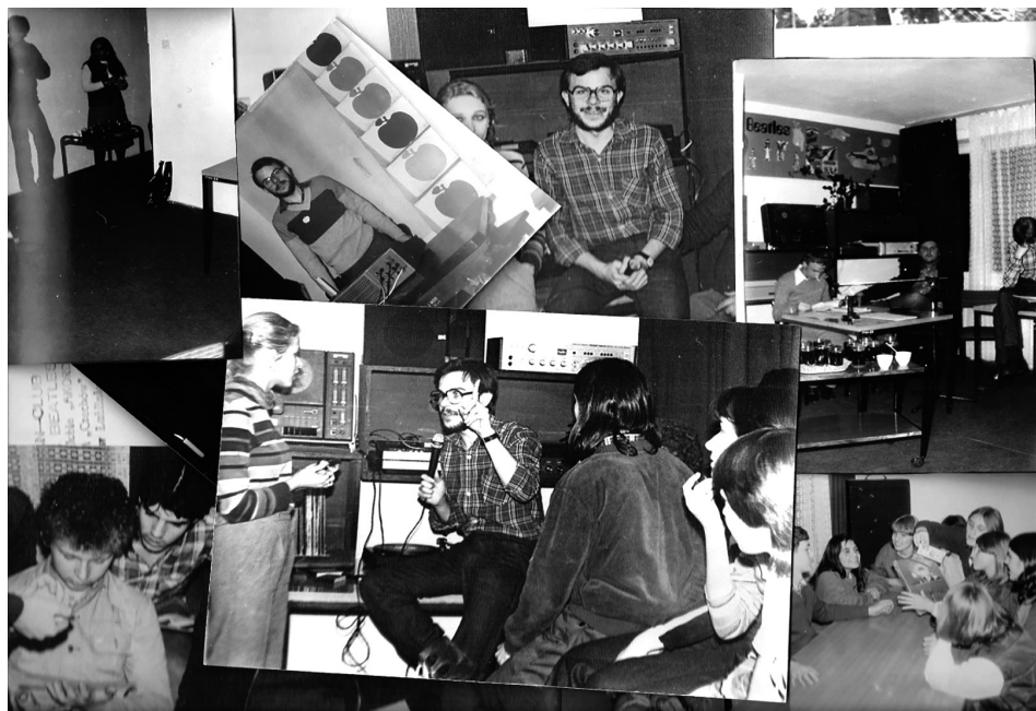
1. Jedno ze spotkań w klubie Akord w latach 1982–1984; fot. Krzysztof Werner

z zagranicznym gościem Johnem McGrathem (o którym będzie jeszcze mowa) oraz przy ciągłym wzroście liczby członków, nie były zainteresowane dalszą działalnością fanklubu pod ich patronatem. Wydaje się, że początkowa zgoda dyrekcji na funkcjonowanie fan klubu wynikała z przeświadczenia, że inicjatywa nie przetrwa okresu próbnego, a nawet jeżeli, to skończy się na kilku mało znaczących spotkaniach. Spółdzielnia nie była przygotowana na tak nietypową działalność, chciała raczej skupiać się wyłącznie na wymogach statutowych, czyli jak najmniejszym kosztem zaspokajać potrzeby integracyjne młodzieży i seniorów osiedla.