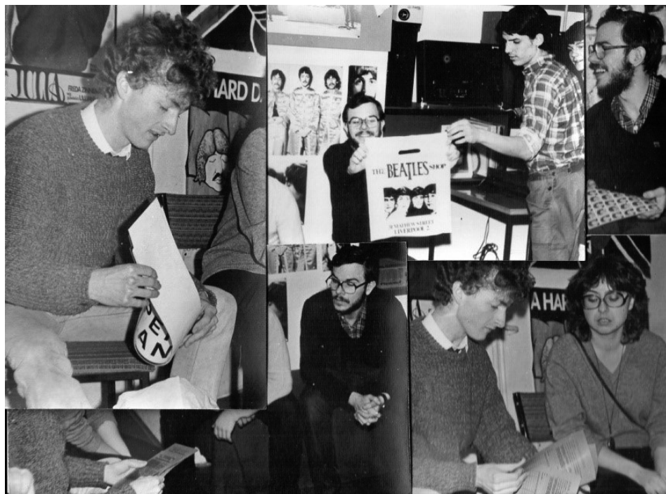
2. Spotkanie z Johnem McGrathem w klubie Akord, 1984 r.