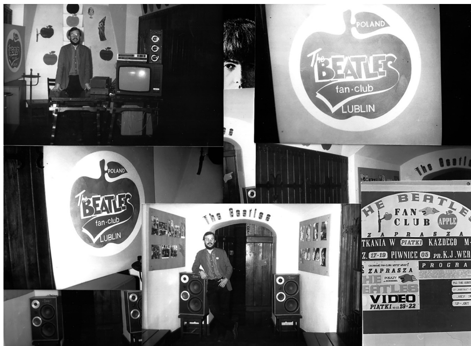
3. Nowa siedziba Fan Club The Beatles w piwnicach Lubelskiego Domu Kultury, 1985 r.

podobne możliwości lokalowe i techniczne oraz dawały równe szanse rozwojowi. Jednak w porównaniu z LDK, ZSMP w ramach przedstawionych możliwości oczekiwał pełnego patronatu, co wiązało się z wprowadzeniem do spotkań klubowych ówczesnej prosocjalistycznej ideologii. Obowiązujący neutralny profil fanklubu nie współgrał z propozycją ZSMP, dlatego postanowiono współdziałać z Lubelskim Domem Kultury przy ul. Wincentego Pstrowskiego 12 (obecnie ul. Peowiaków).