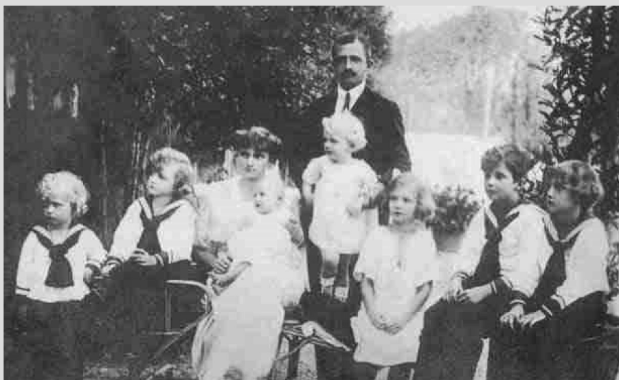
2. Karol i Zyta Habsburg-Lotaryńscy z dziećmi w Szwajcarii w 1921 r.