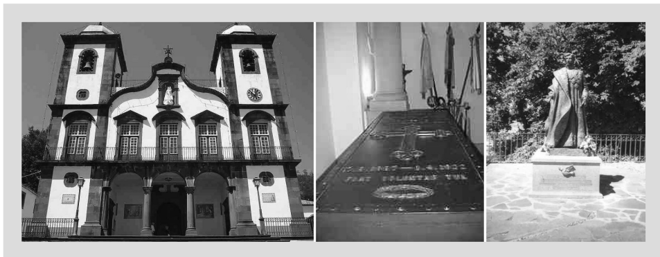
5. Kościół Nossa Senhora, grób i pomnik Karola I w Monte na Maderze, http://cs.wikipedia.org/wiki/Monte_(Funchal) ; http://en.wikipedia.org/wiki/File:Tomb_of_blessed_carl.JPG (dostęp: 15.03.2025)

w sankcji pragmatycznej. Karol IV, tak jak przed dwoma wiekami Maria Teresa, założycielka dynastii habsbursko-lotaryńskiej, szukał w pierwszej kolejności oparcia i pomocy na Węgrzech. Forma realizacji tego zamierzenia w 1921 r. była groteskowa i wyraźnie nieskuteczna 75 . Karolowi nie pomogły towarzystwo i kontrola w drugiej ryzykownej wyprawie na Węgry będącej w drugim miesiącu ciąży żony, która udając się na nią, pozostawiła siedmioro małych dzieci (w wieku od 1. do 9. roku życia) w Szwajcarii. Może nawet byłoby bliższe prawdy stwierdzenie, że w tej drugiej wyprawie cesarz Karol I towarzyszył cesarzowej Zycie.