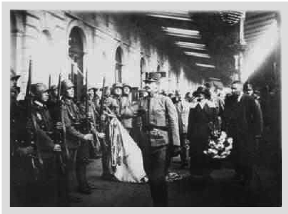
3. Karol IV i królowa Zyta w Sopronie 21 marca 1921 r. przed oddającym im honory oddziałem wojskowym

Poparcie dla Karola IV zgłosiła grupa znanych byłych i aktualnych polityków, wybitnych przedstawicieli węgierskiej arystokracji, snujących plany o przywróceniu dualistycznej monarchii austriacko-węgierskiej, dawnego systemu, jego pozycji ekonomicznej, społecznej i politycznej. Do dyspozycji Karola IV oddał się dowódca okręgu Głównej Królewskiej Armii Węgierskiej. Natychmiast zaprzysiął podległych mu oficerów i żołnierzy jako pierwszy oddział tej armii. Przysięga była składana według tradycyjnej formuły zawierającej zwrot o wierności dla „Karola Habsburga króla Węgier i króla Czech” i tym samym stanowiła prowokację dla niepodległej Republiki Czechosłowackiej.