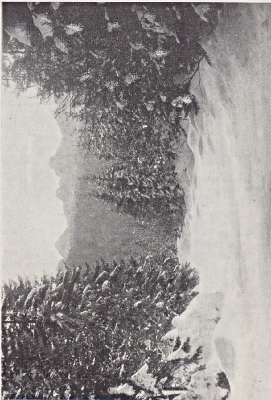
Ryc. 1. Potok Sucha Woda na Polanie Psia Trawka w styczniu 1966 r.