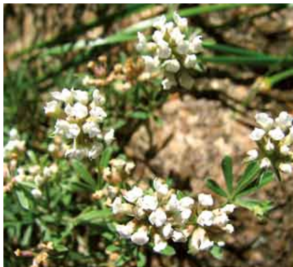
Fot. 122. Dorycnium germanicum na Garbie Pińczowskim (2007)

potwierdzone (Dziubałtowski 1916; Kaznowski 1929; Głazek 1984; Kaźmierczakowa, Perzanowska 1997; Głazek, Kaźmierczakowa 2001). Roślina występowała także w Niece Soleckiej na wzgórzu pomiędzy Pełczyskami a Stradowem (Kostrowicki 1966; Głazek 1983, 1993); później kilkakrotnie poszukiwano tam szyplinu, jednak bezskutecznie (R. Kaźmierczakowa, mat. npbl.). Trzecie stanowisko, o charakterze prawdopodobnie antropogenicznym, podano przed ponad 100 laty ze wzgórza zam-