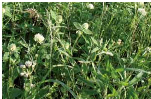
Fot. 121. Trifolium pannonicum na Polanie Podskalskiej w paśmie Radziejowej (2004)