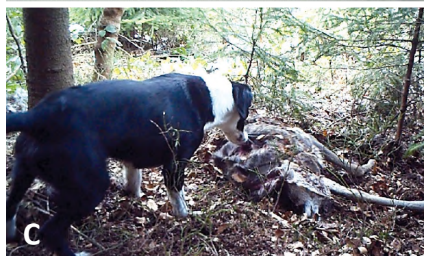
Ryc. 1. A: Pierwsza fotografia z użyciem fotopułapek w GPN – wilk; B: Samiec rysia „R1” z charakterystycznym lewym uchem; C: Pies domowy zwabiony ofiarą rysia (A: 27.12.2013 r.; B: 28.12.2013 r.; C: 27.02.2014 r.)

Fig. 1. A: The first photograph taken by a camera-trap in GNP – grey wolf; B: Lynx male “R1” with a characteristic drooping left ear; C: Domestic dog attracted by the kill of lynx (A: 27 December, 2013; B: 28 December, 2013; C: 27 February, 2014)