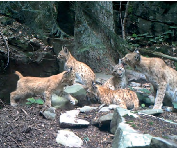
Ryc. 2. Samica rysia „R4” z czterema młodymi (22.08.2014 r.)

Fig. 2. Lynx female with four kittens (22 August, 2014)