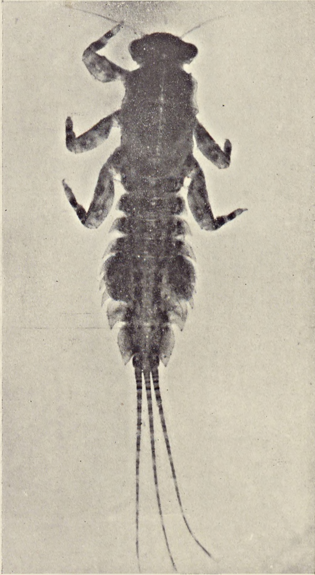
Ephemera karelica (Tiensuu)