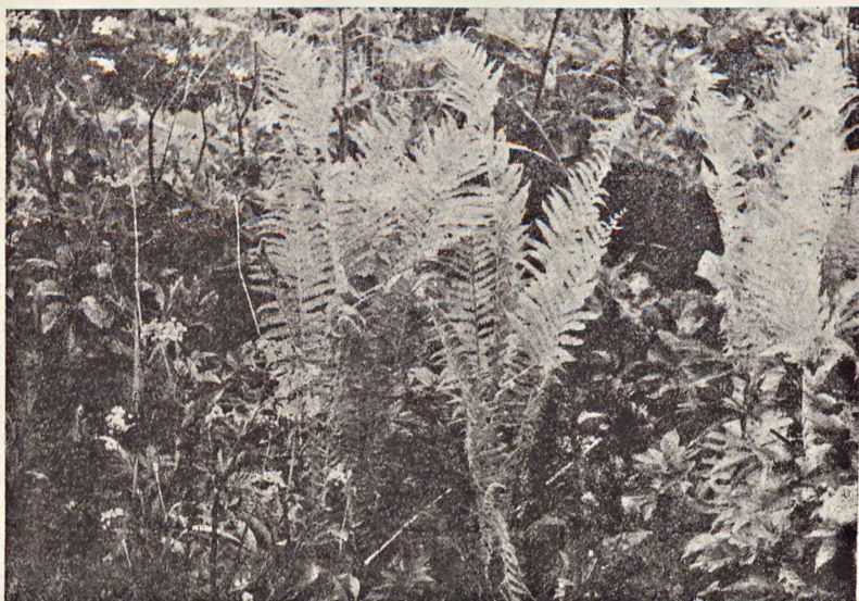
Ryc. 2. Pióropusznik strusi Matteucia struthiopteris koło mostu w Ja- blonce. — The ostrich fern growing near the bridge at Jabłoka.

Na Orawie występuje wyjątkowo licznie wzdłuż rzeki Czarnej Ora- wy, od jeziora zaporowego aż po wieś Podwilk (ryc. 1). Największą żywność wykazuje pióropusznik w zaroślach olszy szarej Alnus incana i w zaroślach wierzbowych osiągając wysokość 1,5 m. Słabiej rozwija się na miejscach odsłoniętych, jak łąki i pastwiska. Na zrębach wyraź-