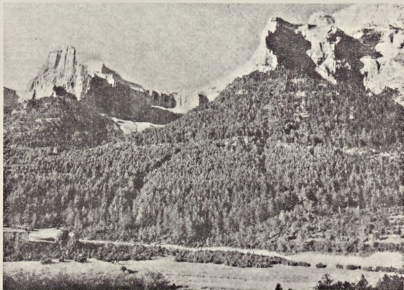
Ryc. 2. Szczyty górskie Tozal del Mallo i Gallinero w północnym obrzeżeniu Doliny Ordesa. (Według J. P e e m a n s'a, 1960 i 1961)

Park Narodowy Ordesa położony jest w środkowej części Pirenejów (prowincja Huesca) na wysokości od 1000 do 2500 m n.p.m. Zajmuje on stosunkowo niedużą powierzchnię (1575 ha) i ciągnie się wzdłuż wąskiej doliny potoku Arrazas o przebiegu E-W. W pobliżu wylotu doliny, od strony zachodniej Parku, nad rzeką Ara mieści się stara osada pasterska Torla, pełniąca dzisiaj rolę ośrodka turystycznego. Znajdują się tu obok nowoczesnych urządzeń turystycznych stare domy aragońskie ozdobione rzeźbami oraz zabytkowy kościół.