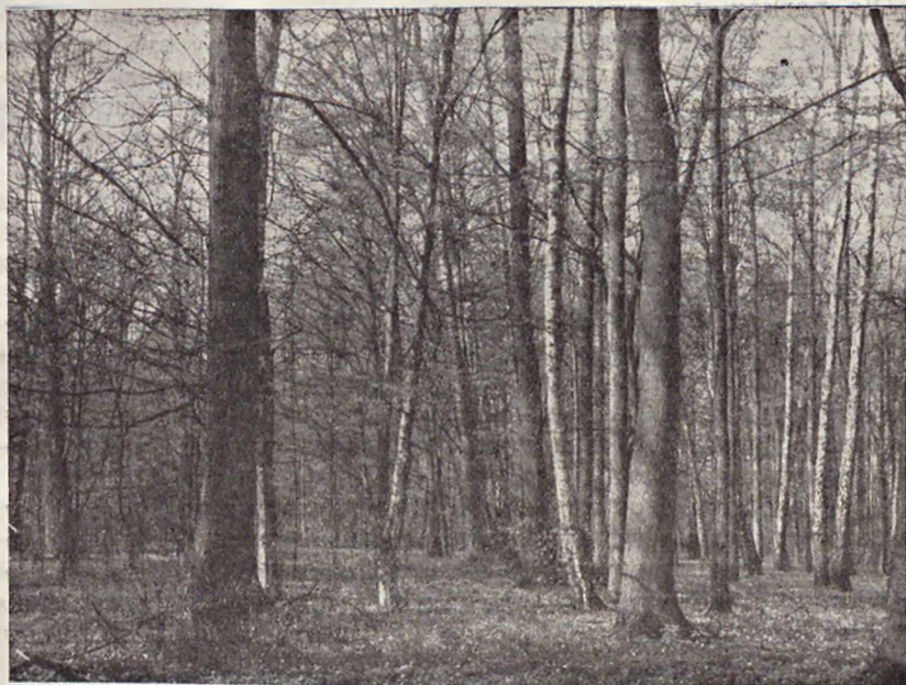
Ryc. 4. Drzewostan 100-letni parku w Uniejowie. Ta część parku jest przykładem sukcesji roślinności — wypierania drzew parkowych przez kształtujące się naturalne zbiorowisko leśne. Drzewostan wymaga prac pielęgnacyjno-hodowlanych. — 100-years-old stand in the park at Uniejow. This part of the park is an example of the succession of plants: the park trees recede before the developing natural sylvan community. The stand requires nursing and silvicultural operations.

dowych w oparciu o pełną dokumentację historyczną i przyrodniczą. Użytkownicy tych parków winni być w pełni świadomi ich szczególnych obowiązków. Dla parków grupy II i III winny być sporządzone plany zagospodarowania i konserwacji respektujące w całej pełni spuściznę myśli architektonicznej i wartości przyrodnicze parku; prace wykonawcze mogą prowadzić użytkownicy we własnym zakresie lecz pod fachowym nadzorem ogrodnika. Zagospodarowanie parków grupy III winno wynikać z programu jego użytkowania. Parki grupy IV, jak się zdaje — najliczniejsze, winny być utrzymywane przez użytkowników w miarę możliwości w najlepszej formie estetycznej w myśl wskazówek uproszczonej inwentaryzacji, zgodnie z potrzebami i stanem zachowania parku. Niedopuszczalna jest tu jakakolwiek zmiana sposobu użytkowania, w rodzaju przeznaczenia części parku na boisko sportowe, pod zabudowę itp.