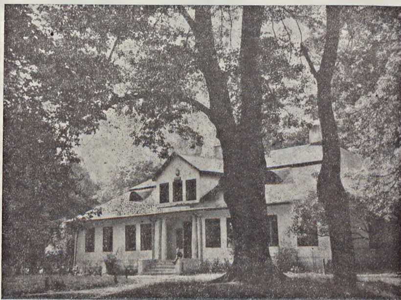
Ryc. 1. Park w Odrowążu, otaczający szkołę; zapewnia jej najlepsze warunki higieniczne i estetyczne. — The park at Odrowąż surrounds the school building and provides good sanitary and esthetic conditions.

mechanika, traktorzysty, pracującego wiele godzin ze stałą napiętą uwagą w hałasie i dymie spalin, hodowcy spędzającego większość czasu w zamkniętym pomieszczeniu obory, jest nie mniej szkodliwa dla zdrowia niż praca w mieście, ludzie ci zasługują również na wypoczynek w kontakcie z zielenią ozdobną i nie opylaną truciznami. Przykładem parku