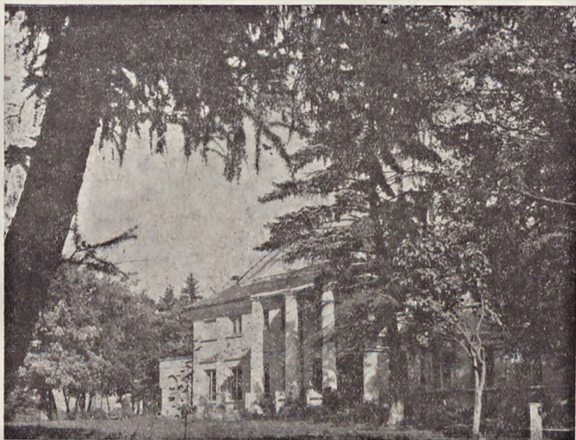
Ryc. 2. Wiejski Ośrodek Zdrowia w Mrodze, powiat łowicki. Przykład społecznej funkcji parku. — The Rural Health Centre at Mroga in the district of Łowicz. The park fulfills a social service.

Niemale jest znaczenie parków dla kształtowania warunków ekologicznych sprzyjających podnoszeniu produkcji rolnej poprzez wpływ na biocenozę pól i na klimat. Rolę par-