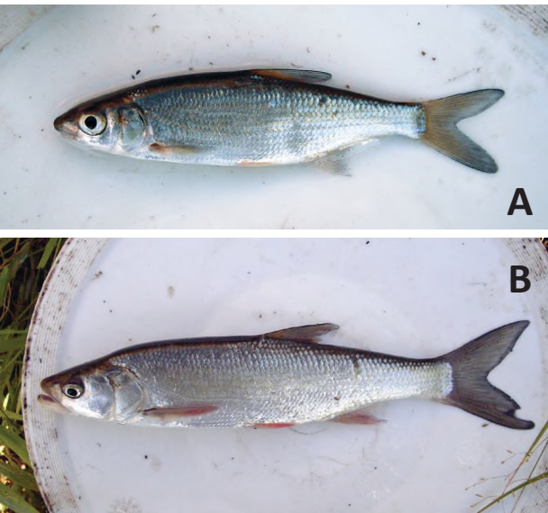
Ryc. 3A–B. Certa Vimba vimba (A) i boleń Leuciscus aspius (B) złowione w ujściu Fryby (Chełmno, 11.10.2012 r.;)

we, jak: okoń (Fryba, Brda), krąp (Fryba), płoć (Fryba), ciernik (Struga Niewieścińska) i cierniczek Pungitius pungitius (Struga Niewieścińska i Drybok). Spośród rodzimych reofilnych gatunków największe zagęszczenia osiągał jaź i jelec w Dopływie z Gnojna, natomiast więcej inwazyjnych babkowatych (babka łyśa i babka rurkonosa) obserwowano w Zuzance. Obecność pojedynczych osobników gatunków obcych, takich jak karp Cyprinus carpio , czebaczek amurski Pseudorasbora parva i amur biały Ctenopharyngodon idella , ograniczała się głównie do sąsiedztwa stawów hodowlanych. Z gatunków chronionych najwyższe zagęszczenia zanotowano dla kozy w Zuzance i Dopływie z Gnojna (tab. 3). Dla Osy, w której połowy prowadzono dwukrotnie, liczebności poszczególnych gatunków w obu sezonach były zbliżone. Natomiast w Dopływie z Gawrońca, w pierwszym okresie badań skład gatunkowy i liczebność ryb były zdecydowanie uboższe, zapewne z powodu prowadzonego bagrowania cieku przed wykonaniem połowu.