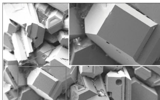
Na okładce: Obraz SEM struktury polikrystalicznej węglika krzemu politypu 3C-SiC otrzymanego metodą fizycznego transportu par.