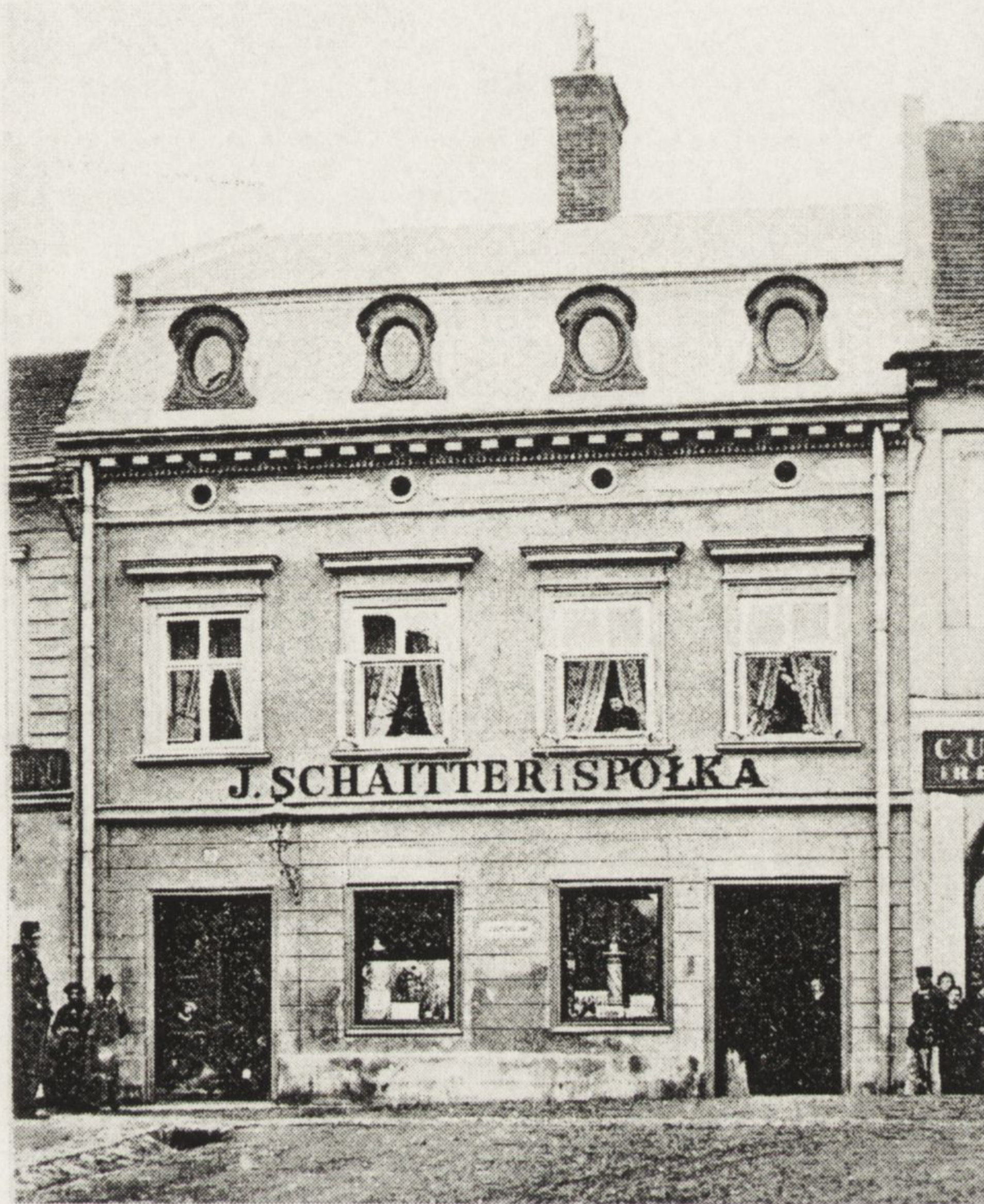
Ryc. 2. Front domu przy ulicy Farnej (obecnie Kościuszki) stanowiącego od 1834 roku siedzibę firmy SCHAITTERA (fotokopia z maszynopisu ATAMANA 1978).